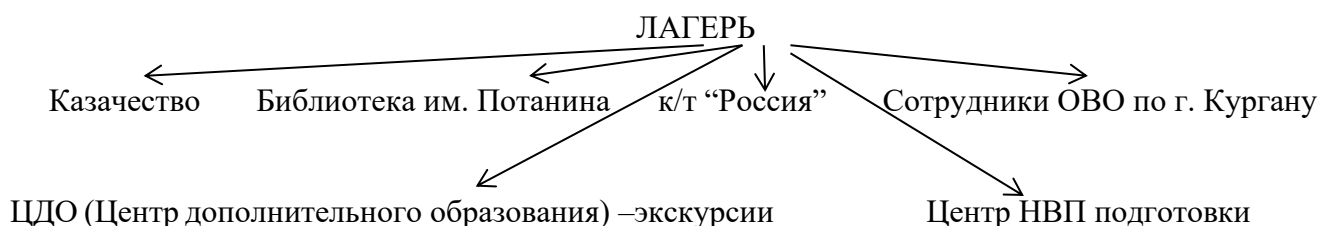
Схема сотрудничества лагеря с культурными и спортивными учреждениями города в октябре 2024 года

Тесное сотрудничество с учреждениями культуры и спорта и предприятиями города позволяет удовлетворить потребности детей в занятиях спортом и организовать их полноценный досуг.